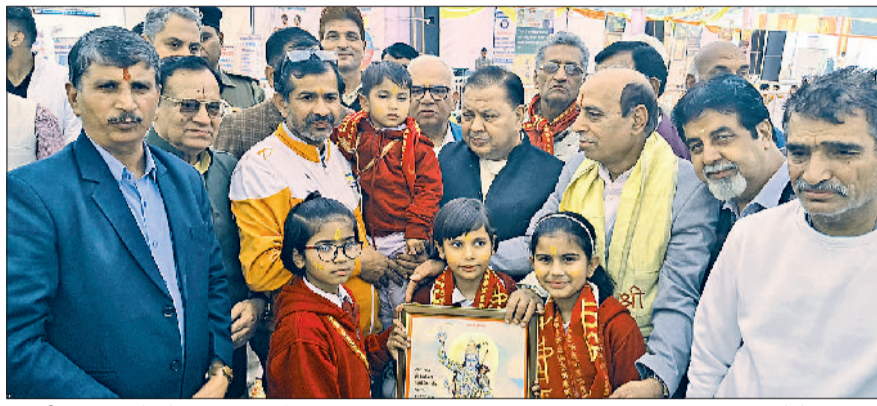
भिवानी। प्रतिभागियों को सम्मानित करते हुए।