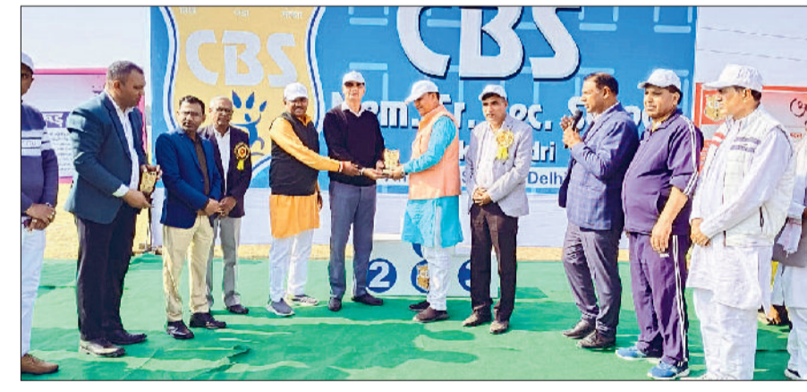
चरखी दादरी। कार्यक्रम में मुख्यअतिथि को सम्मानित करते हुए।

सीबीएस मेमोरियल स्कूल मोडी में एक भव्य इंटर स्कूल स्पर्धा का आयोजन किया गया। इस प्रतियोगिता में क्षेत्र के विभिन्न स्कूलों के 224 छात्र-छात्राओं ने हिस्सा लिया। स्पर्धा आयु वर्ग के अनुसार लड़के और लड़कियों के लिए अलग-अलग आयोजित की गई थी, जिसमें रस, रीले, शॉटपुट, डिस्कस थ्रो आदि अलग अलग वर्ग की रही, जिससे सभी प्रतिभागी अपनी उम्र और क्षमता के अनुसार प्रतिस्पर्धा कर सके। प्रतियोगिता का समापन समारोह अत्यंत उत्साहपूर्ण माहौल में