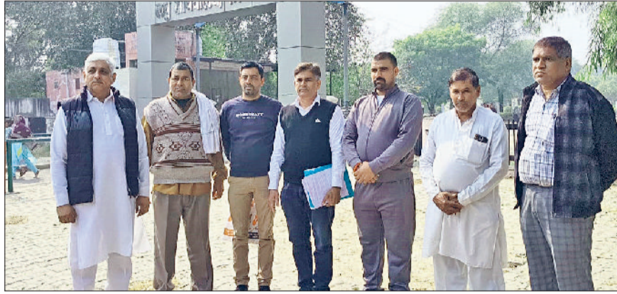
भिवानी। उपायुक्त को गांगपत्र सौंपने जाते निजी बस संचालक।