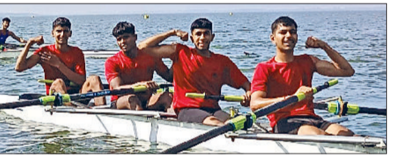
तेशाम। नौकायन में भाग लेते प्रतिभागी।