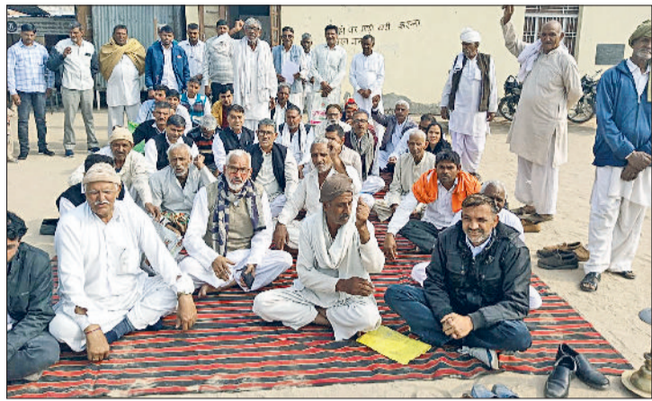
बाढ़ड़ा। तहसील कार्यालय परिसर के बाहर धरने पर बैठे किसान।