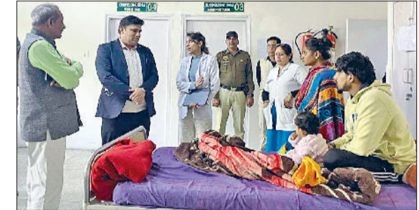
भिवानी। नशा मुक्ति केंद्र का निरीक्षण करते हुए।