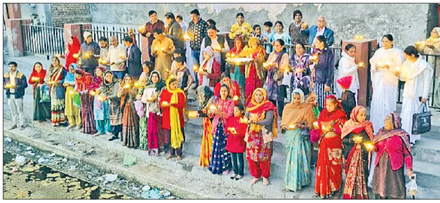
भिवानी। हनुमान जोहड़ी मंदिर परिसर में दीप जलाते हुए।

श्री कृष्ण द्वारा दिया गया गीता का उपदेश किसी एक व्यक्ति नहीं बल्कि सम्पूर्ण मानव जाति के लिए है